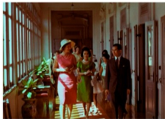
Prinsesse Margrethe besøger Thailands konge og dronning Har du mødt mange mennesker fra andre kulturer?