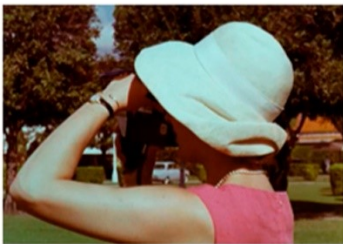
Prinsesse Margrethe betragter Bangkok gennem et kamera Har du fulgt meget med i de kongeliges færden?

Klippet stammer fra en reportage, der dækker Kronprinsesse Margrethes officielle rejse i Fjernøsten i 1963. Hun rejser rundt i Thailand og besøger det thailandske kongepar i Bangkok. Herfra fortsætter rejsen til Malaysia.