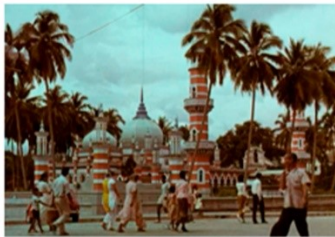
Der er flotte byrøringer og mange mennesker på gaden i Malaysias hovedstad Fortæl om et land eller sted, du har besøgt, som har gjort indtryk