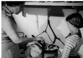
En kvinde støger frikadeller, mens et barn kigger på Er du god til at lave mad? Hvad kan du lide at lave/spise?