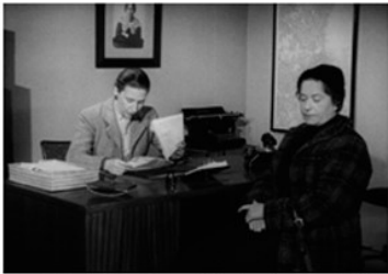
To kvinder sidder på et kontor. Den ene arbejder, den anden venter på at få arbejde Har du eller din ægtefælle arbejdet ude eller været hjemmegående?

Når mor bliver syg, må en anden træde til i hendes sted. I denne film overtager en professionel husmoderafløser alle hjemmets pligter, mens mor er på hospitalet. Husmoderafløseren gør rent, laver mad og læser højt for børnene, før de skal sove.