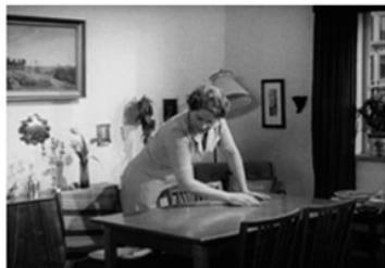
En kvinde er i færd med at gøre rent i hjemmet Hvordan var arbejdsfordelingen i husholdningen i jeres hjem?