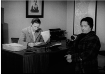
To kvinder sidder på et kontor. Den ene arbejder, den anden venter på at få arbejde Har du eller din ægtefælle arbejdet ude eller været hjemmegående?

Når mor bliver syg, må en anden træde til i hendes sted. I denne film overtager en professionel husmoderafløser alle hjemmets pligter, mens mor er på hospitalet. Husmoderafløseren gør rent, laver mad og læser højt for børnene, før de skal sove.