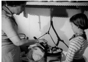
En kvinde støger frikadeller, mens et barn kigger på Er du god til at lave mad? Hvad kan du lide at lave/spise?