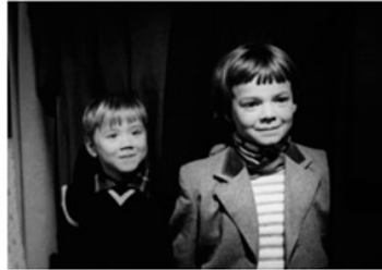
To små børn står smilende og tålmodigt og venter Hvordan var dine børn, da de var små?