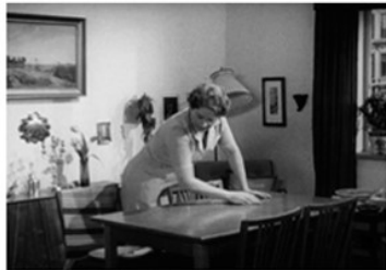
En kvinde er i færd med at gøre rent i hjemmet Hvordan var arbejdsfordelingen i husholdningen i jeres hjem?